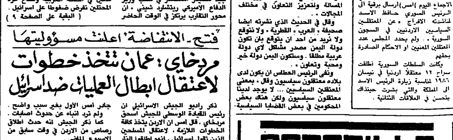
قيل الرئيس اليمني الجنوبي جدير ابو بكر العطاس ان دولة الوحدة اليمنية الجديدة ستكون عملا اساسيا من عوامل الاستقرار والامن في المنطقة. واصف قوله في حديث نشرته صحيفة الوطن - الكويتية امس. وستتعلق مع اشقاقات تحرير هذه المسالة ولتعزيز التعاون في مختلف المجالات. وقال في الحديث الذي نشرته ايضا صحيفة القطرية. ولا تتوقع ولا تريد من احد ان يتوقع بان تكون دولة اليمن مصدر مشكل لأي دولة عربية مطلقا. وستكون اليمن دولة خير ومحبة وتعاون. ونفى الرئيس العطاس ان يكون لدى بلاده معتقلون سياسيون وقال. بمعنى المعتقلين السياسيين... لا يوجد لدينا معتقلون سياسيون ولكن هناك بعض الحكوميين في بعض القضايا السياسية.